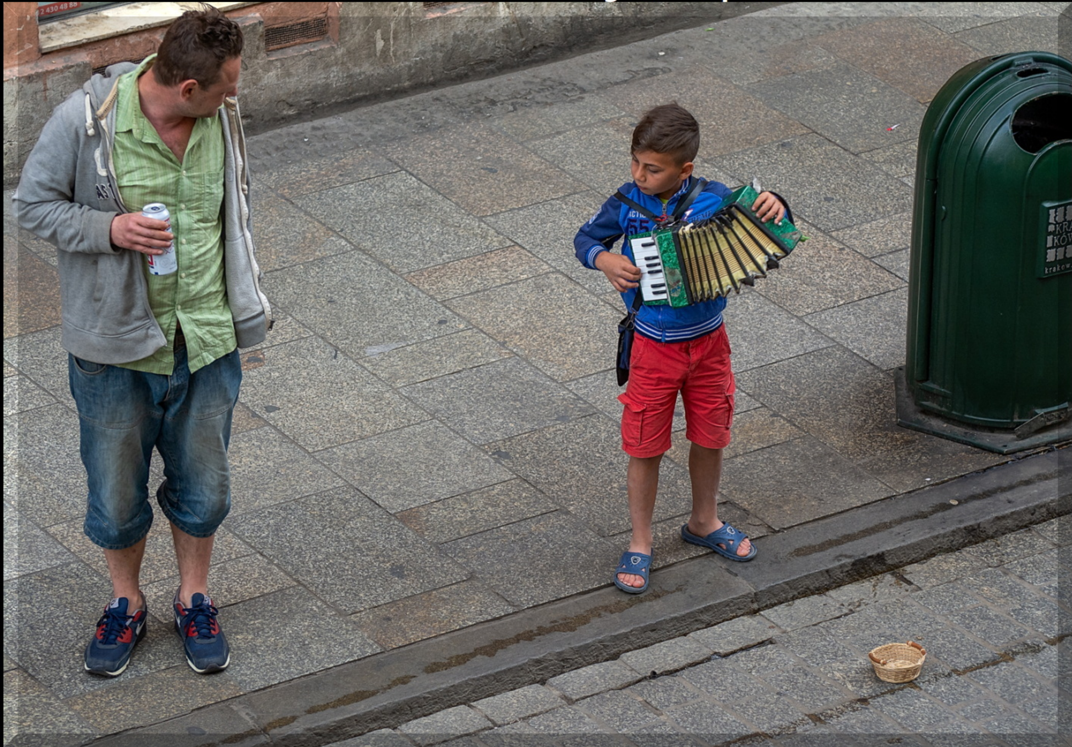
DIFO DIPLOM En bild som väcker intresse.