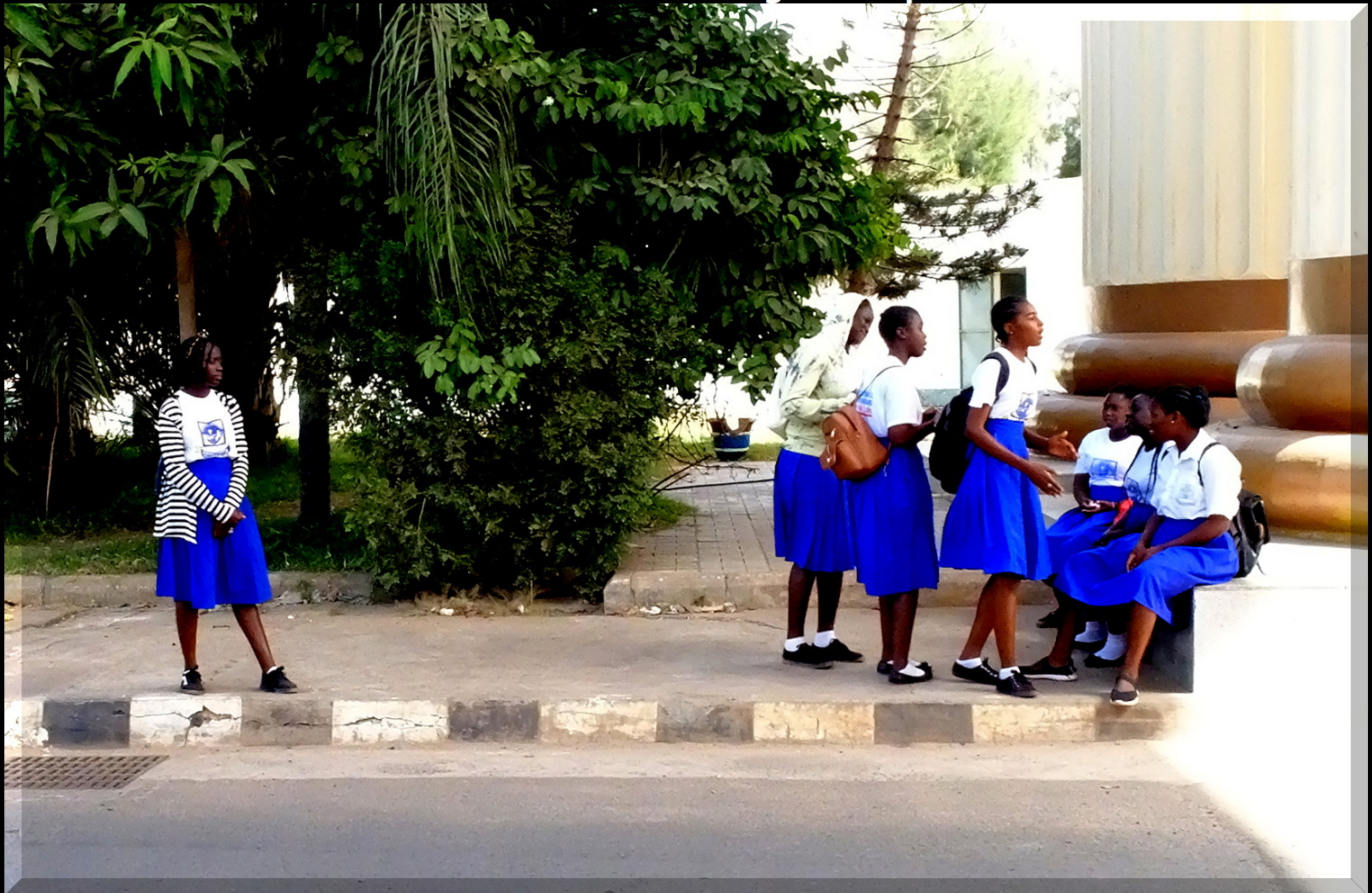
DIFO DIPLOM Bra bild som engagerar