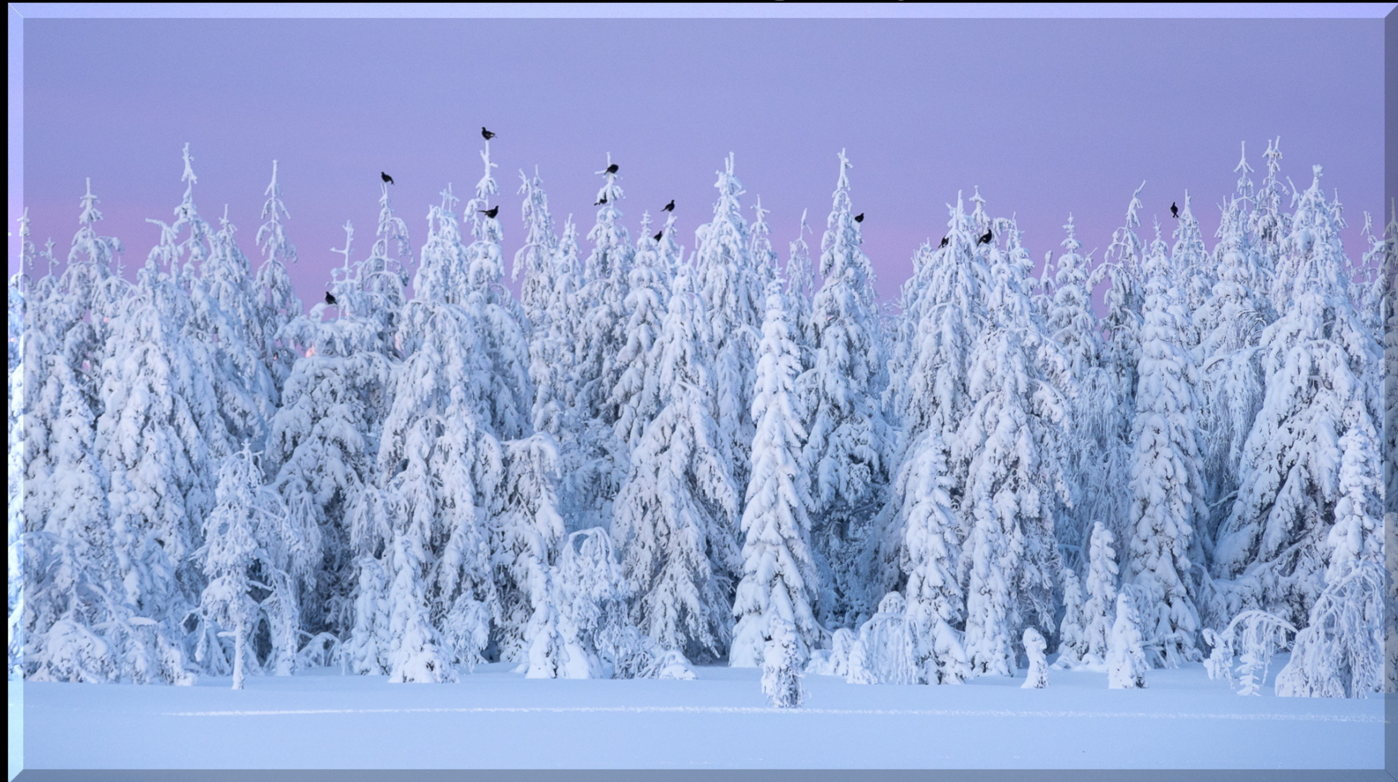
DIFO DIPLOM En bild med fina kontraster tagna i stunden.