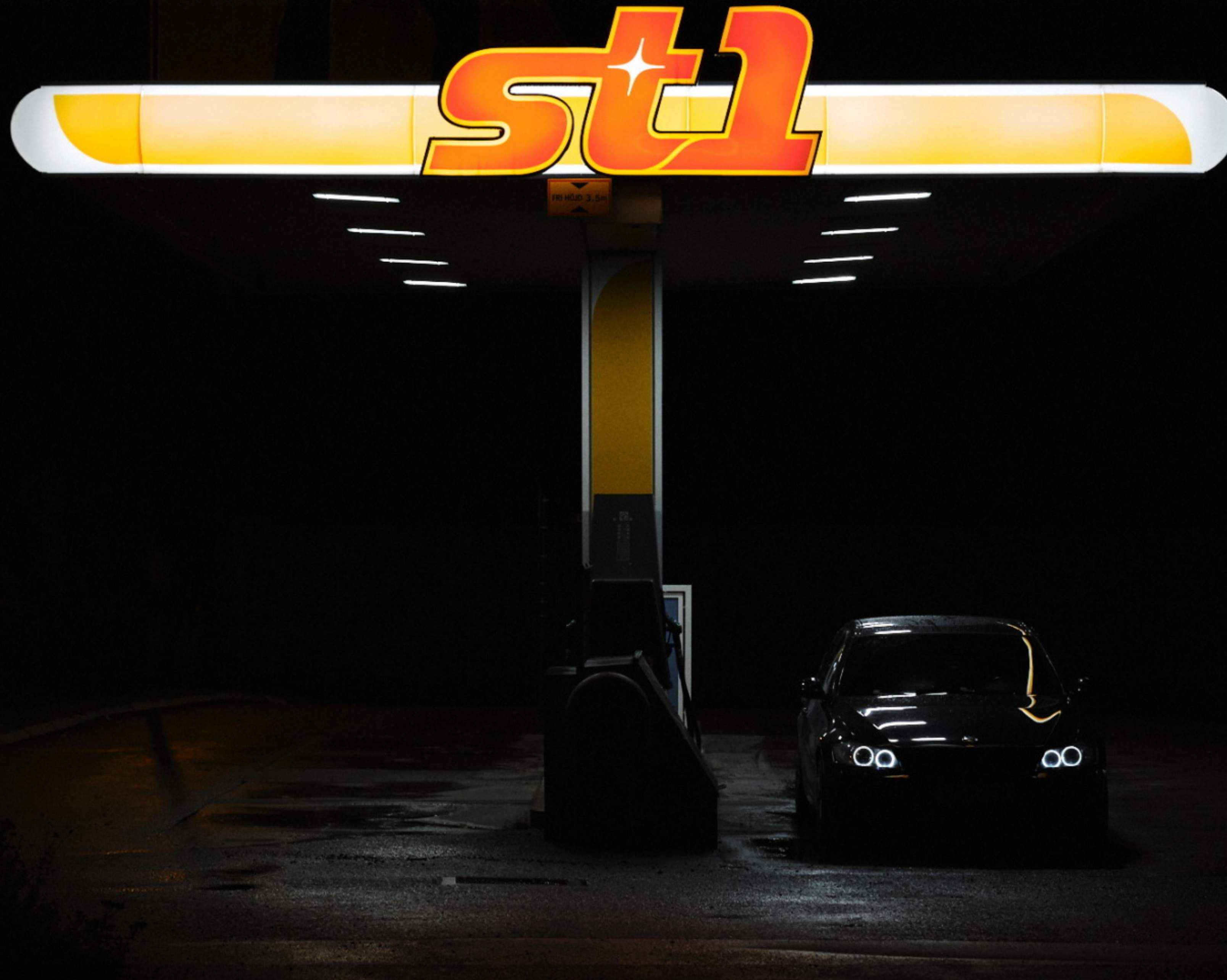
DIFO DIPLOM En estetisk och avskalad bild.