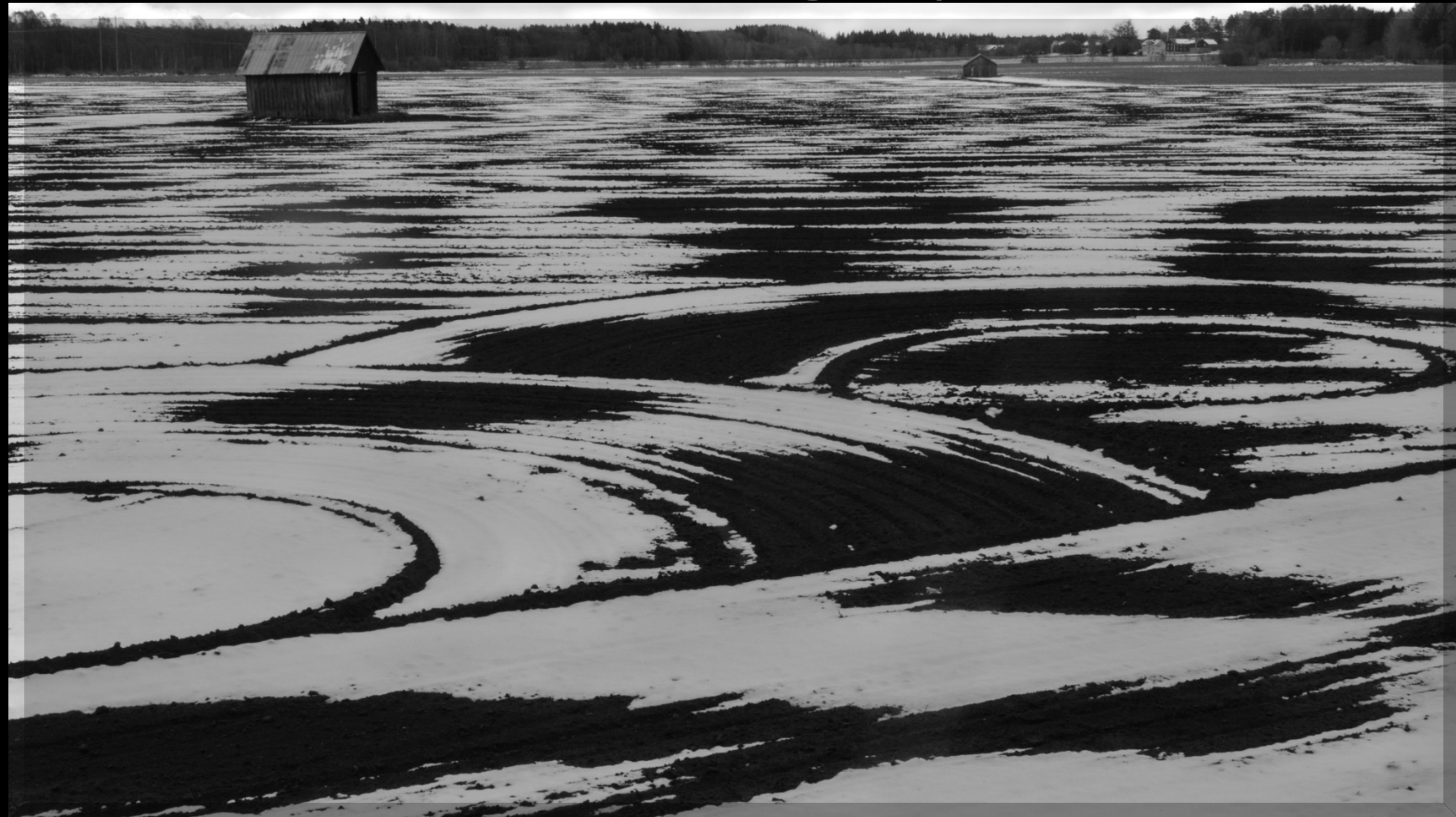
DIFO DIPLOM Bilden har en spännande komposition.