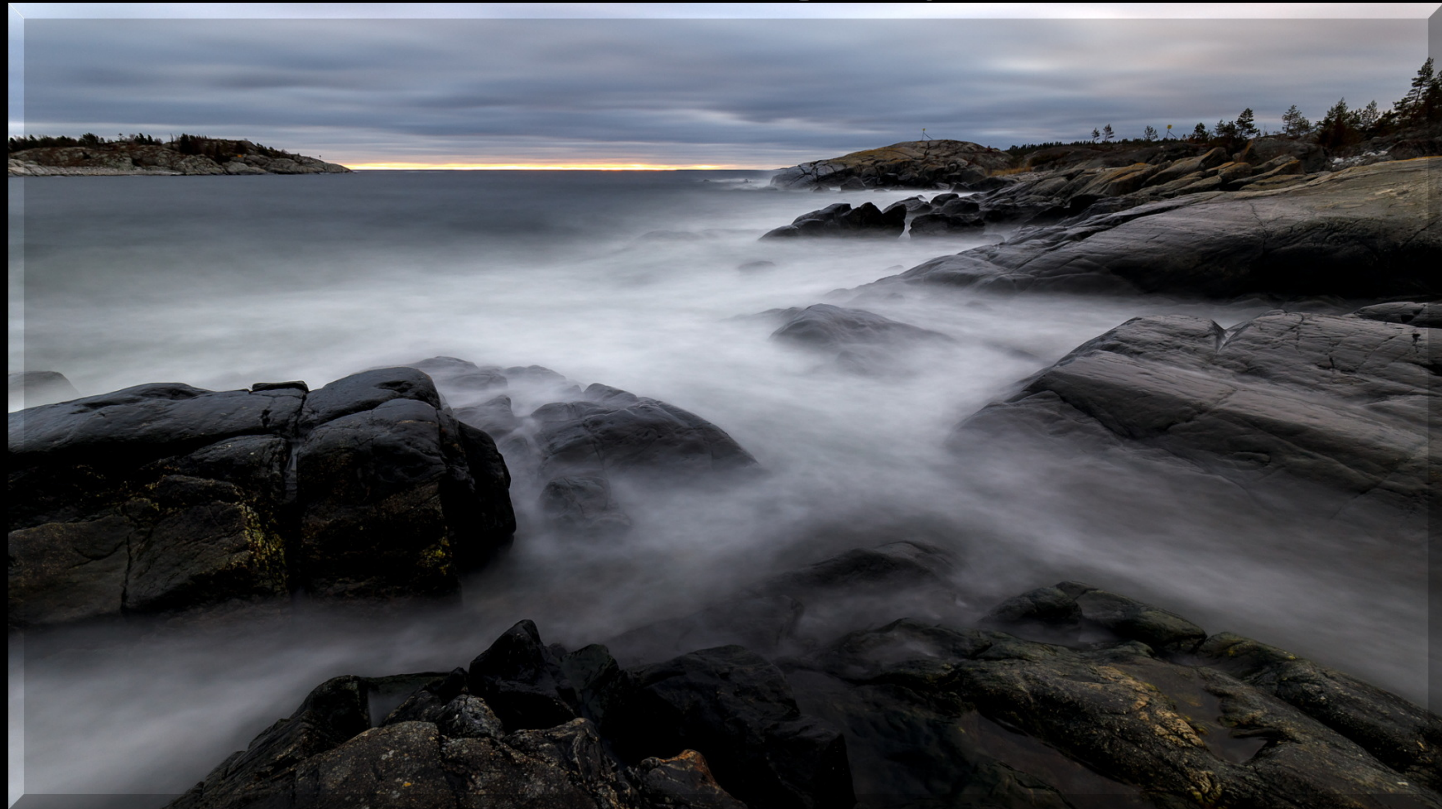
DIFO DIPLOM Mycket välplanerad och fin bild.