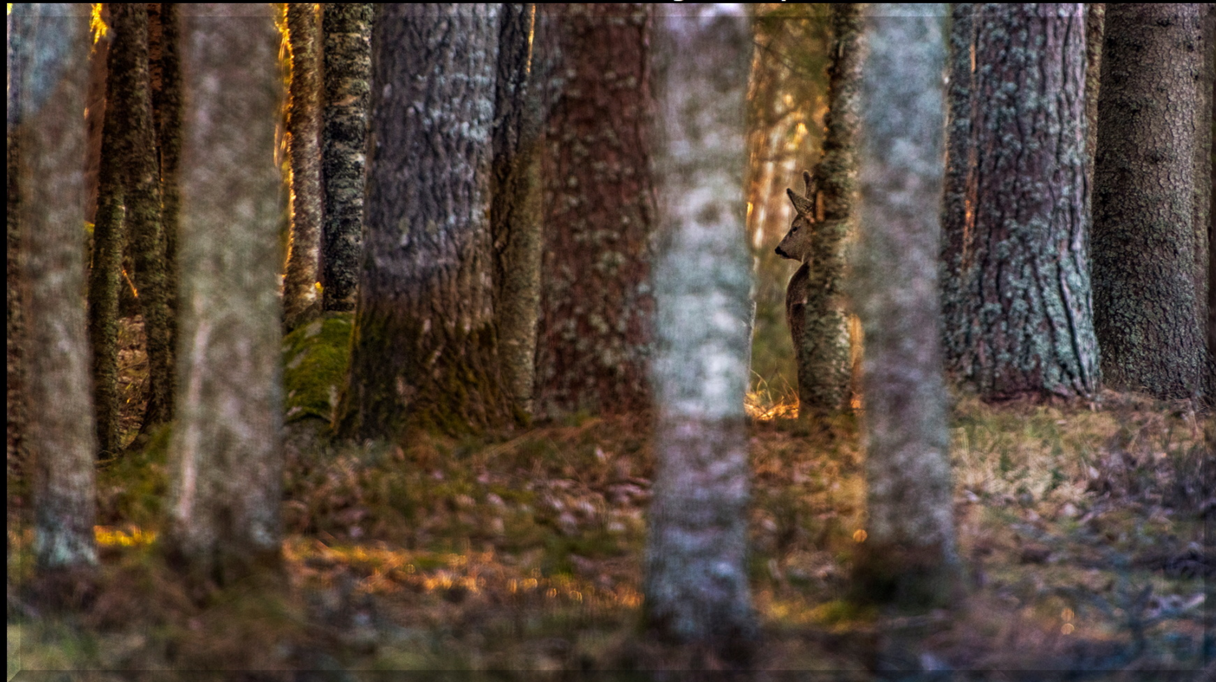
DIFO DIPLOM Nyfiket och varsamt fångat.