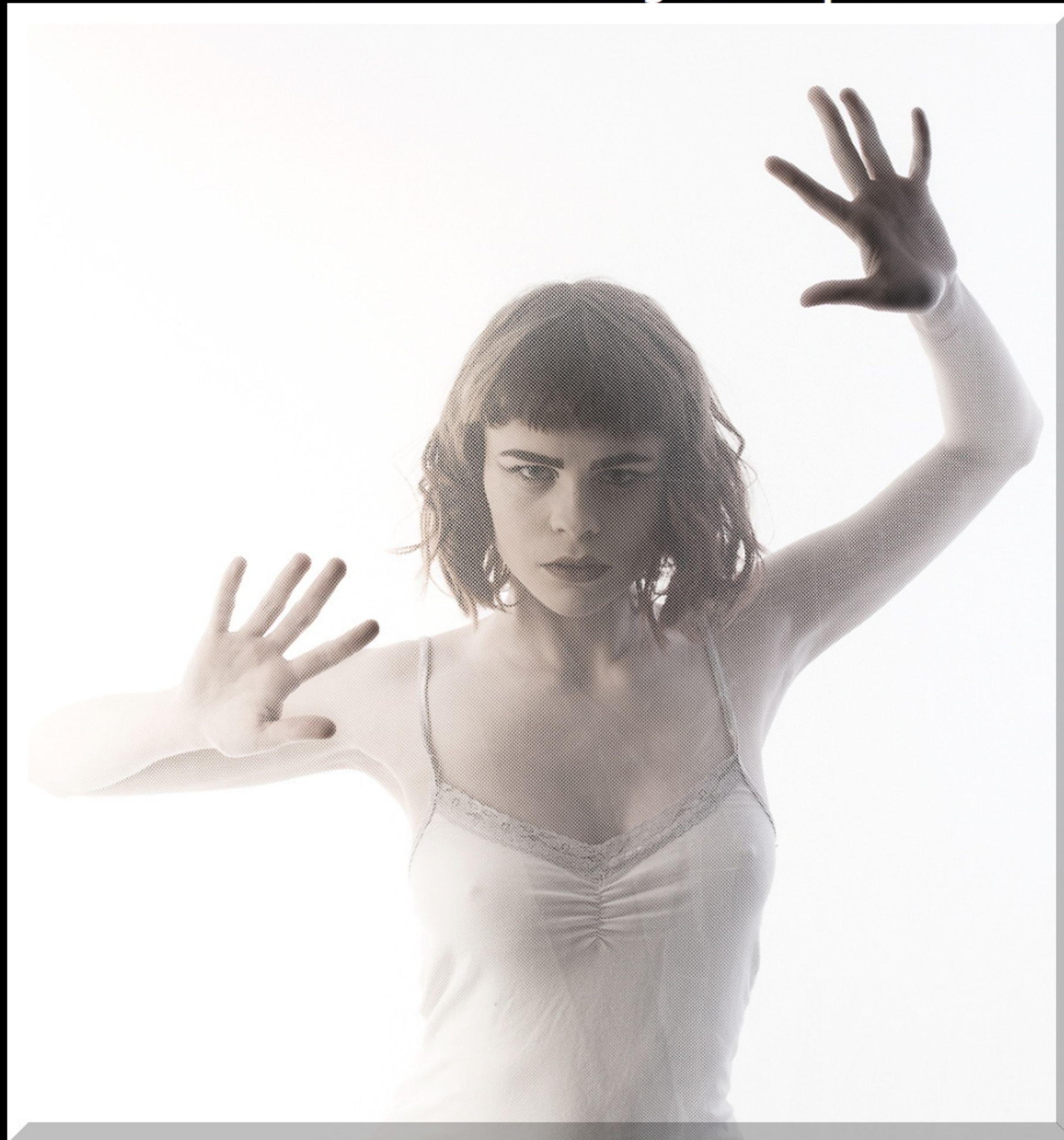
DIFO DIPLOM En bild med spännande och agerat uttryck.